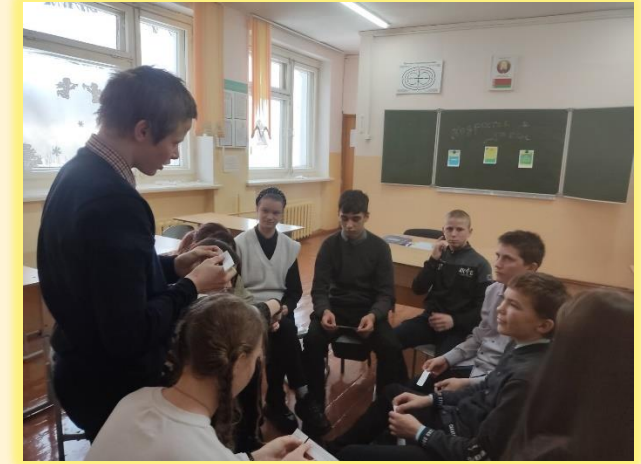
Воспитательный час «Как не стать жертвой насилия»