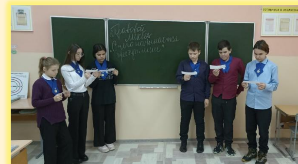
Правовой ликбез «С чего начинается преступление»