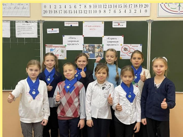
Беседа-тренинг «Умей сказать Нет»»

Мероприятия, проведенные в рамках проекта :