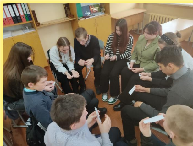
Круглый стол «Подросток и закон: изучаем, знаем, соблюдаем»