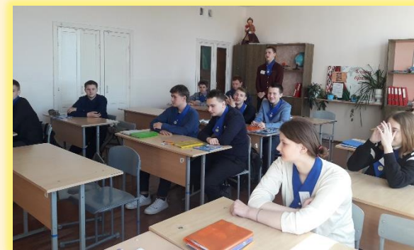
Беседа «Правонарушения – дорога в бездну»